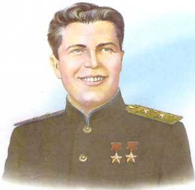
Григорий Пантелеевич КРАВЧЕНКО 1912–1943 генерал-лейтенант авиации, первый дважды Герой Советского Союза

От кого Знахаровский В. И. Откуда г. Москва, ул. Новокошарская, р. 12, к. 3, кв. 601 Индекс места отправления 111673