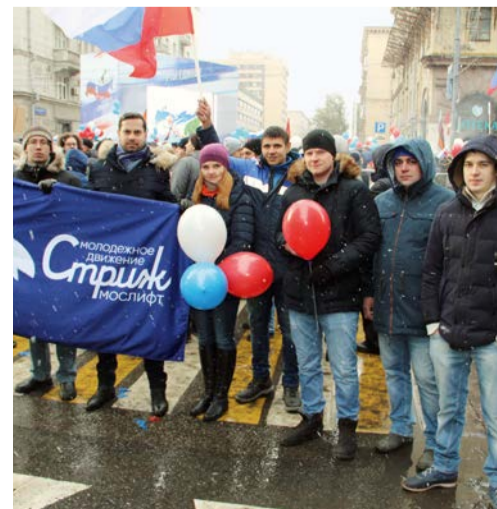
Представители Молодёжного совета ОАО «Мослифт»

По давней традиции в праздничном шествии приняли участие работники ОАО «Мослифт» во главе с руководством предприятия.